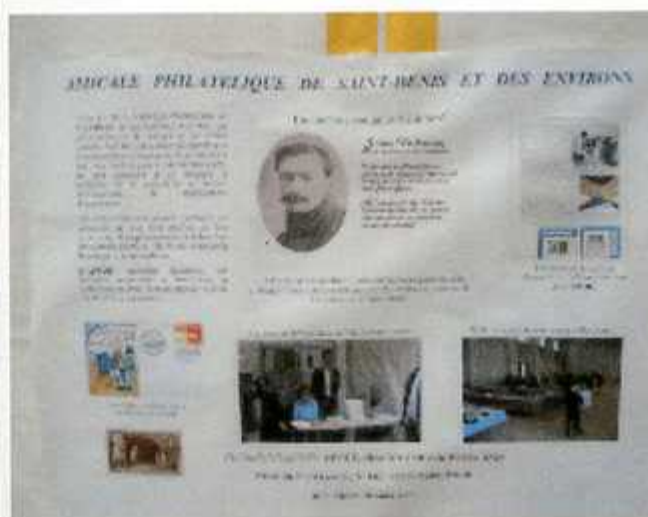
Une affiche de présentation de l'Amicale faite par Guy Germain