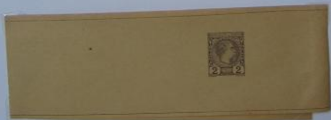
Bande pour journaux de Monaco