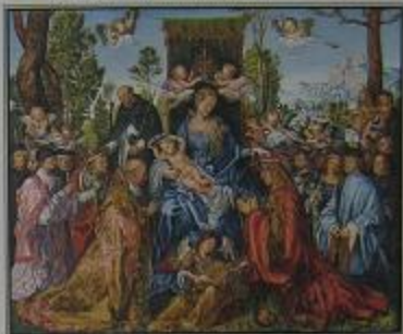
ALBRECHT DÜRER 1471-1528 NÁRODNÍ GALERIE V PRAZE